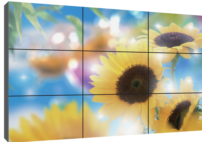
9面(3×3面)マルチディスプレイ設置例

液晶看板アイキャッチグループでは、アイキャッチシリーズ以外にも、多種多様なデジタルサイネージに応えられるよう日々努力しております。業界トップクラスの代理店数が可能にする、ネットワークを通じて、不可能を可能にしてみました。屋外の液晶看板をもっと身近に感じて頂けるよう、液晶看板アイキャッチグループは進化し続けます。※屋内外の液晶看板サイネージのご相談はお気軽にご連絡下さい。